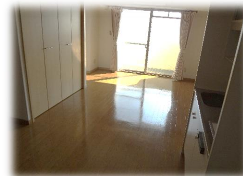
バリアフリーのフローリング クローゼット完備