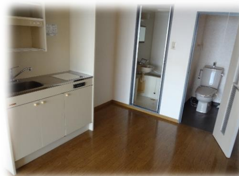
各部屋に 簡易キッチン ユニットバス トイレが配置されています